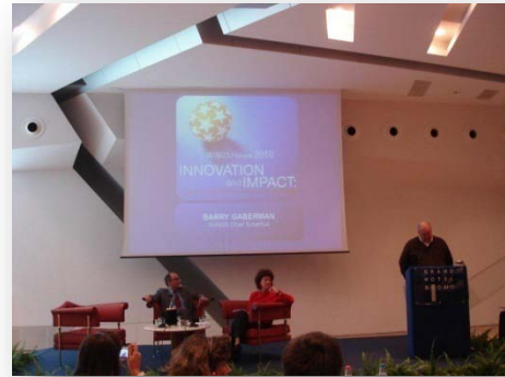
Conferencia Wings en Como, Italia.