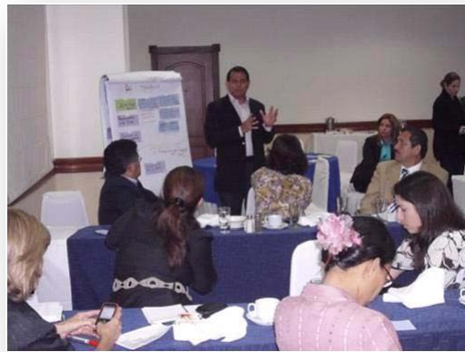
Talleres Pymes Seguimiento del Proyecto BID-OEA en Chile y el Salvador