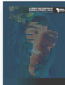
La empresa como promotora del desarrollo económico y social: Casos exitosos en América Latina.