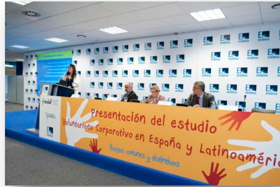
Presentación Estudio Voluntariado Corporativo en Madrid, España, octubre de 2010.