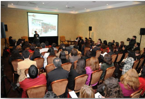
Presentación Estudio Voluntariado Corporativo en Santiago, Chile, agosto de 2010.